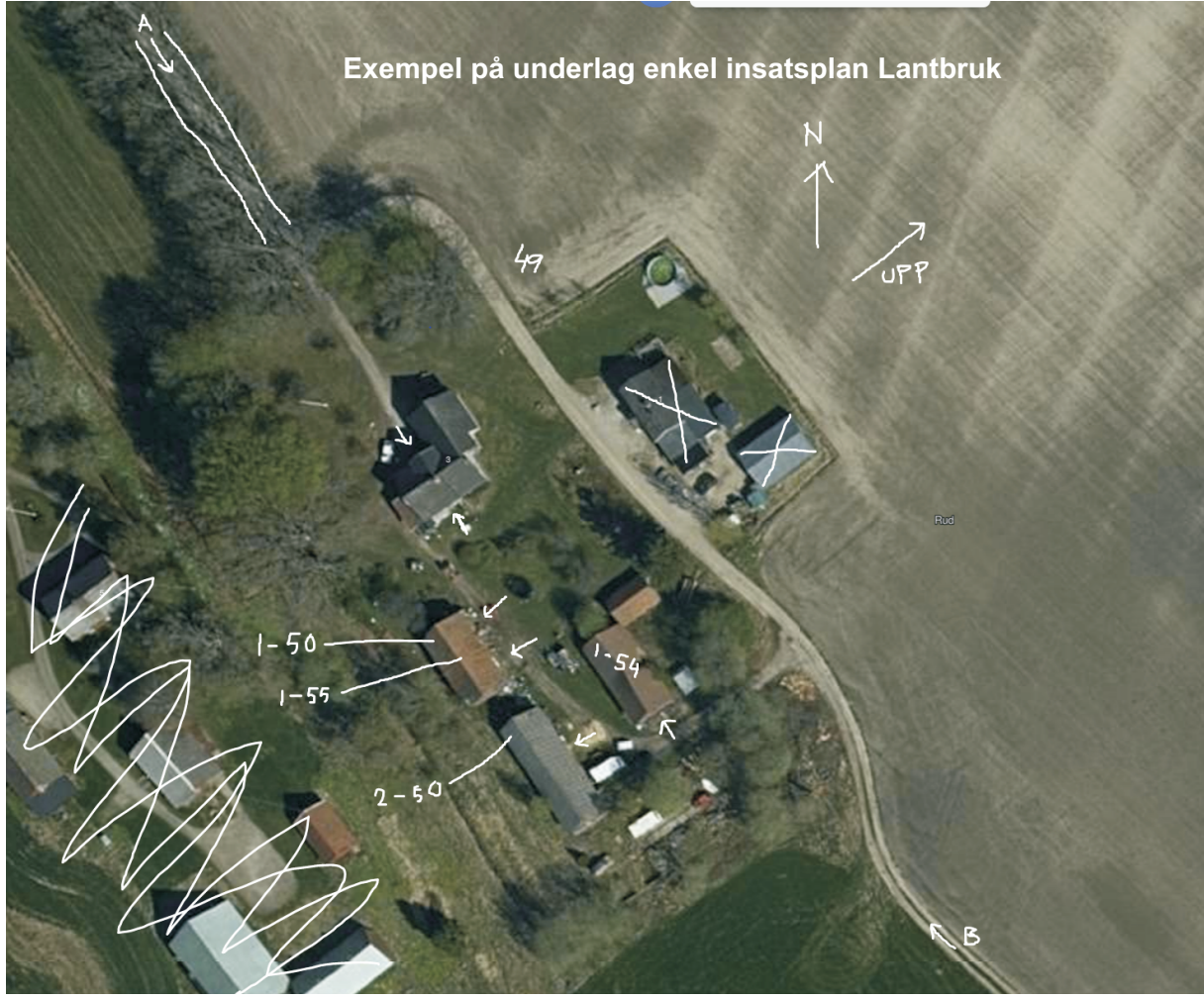
Exempel på underlag enkel insatsplan Lantbruk